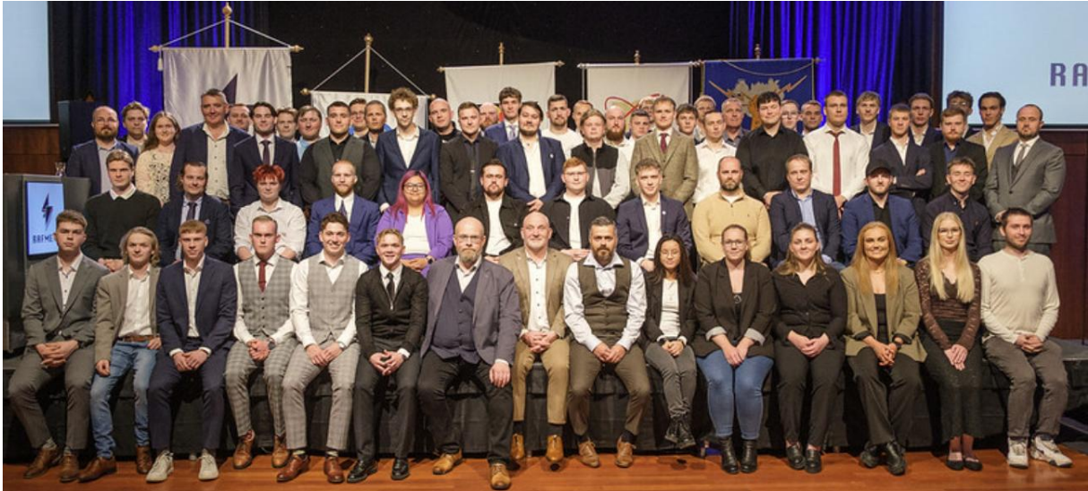
Afhending sveinsbréfa í september 2025.

Í sveinsbréfaafhendingunni í september var stærsti hópur kvenna sem hefur fengið afhent sveinsbréf að loknu einu prófi eða ellefu. Hér til hliðar má sjá hluta hópsins.