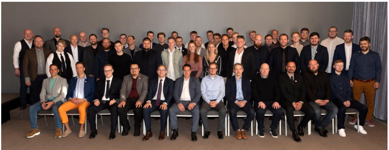
Þessi mynd er frá afhendingu sveinsbréfa 17. september 2022